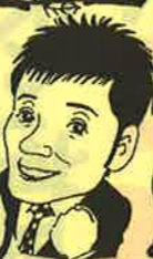
ホームページ 見ると!