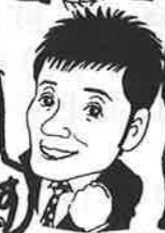
ホームレス 見守り