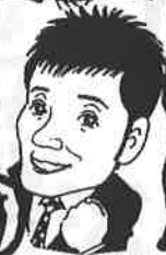
ホームレス 見守り!

皆様の「シヨリ」 社「シヨリ」の「シヨリ」など 困っている家ありませんか!! 当社におまかせ!!