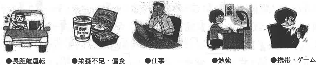
●長距離運転 ●栄養不足・偏食 ●仕事 ●勉強 ●携帯・ゲーム

最近目が疲れやすい。目がかすむ。見えにくいなどの症状はありませんか。東洋医学では『目は内臓の鏡』。目には内臓の機能が弱つてくるといって内臓の機能が弱つてくると目に症状がでやすくなると思います。「血を管理する肝」「水の巡りを管理する腎」が目と関係が深い臓器です。つまり、目も体の一部です。体が健康で目だけが悪くなるものではありません。当店では、「諦めていた目の症状が嘘のように良くなった」という喜びの声が届いています。