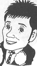
ホムペ-見てください!