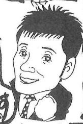
ホームページ 見てください!