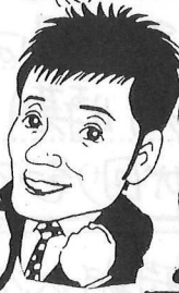
ホムペを見てください!

皆様の悩み・シヨリ 松ゴキブリ、ハチ、ダニなどで 困っている家ありませんか!?! 当社におまかせ下ホ! やっつけ